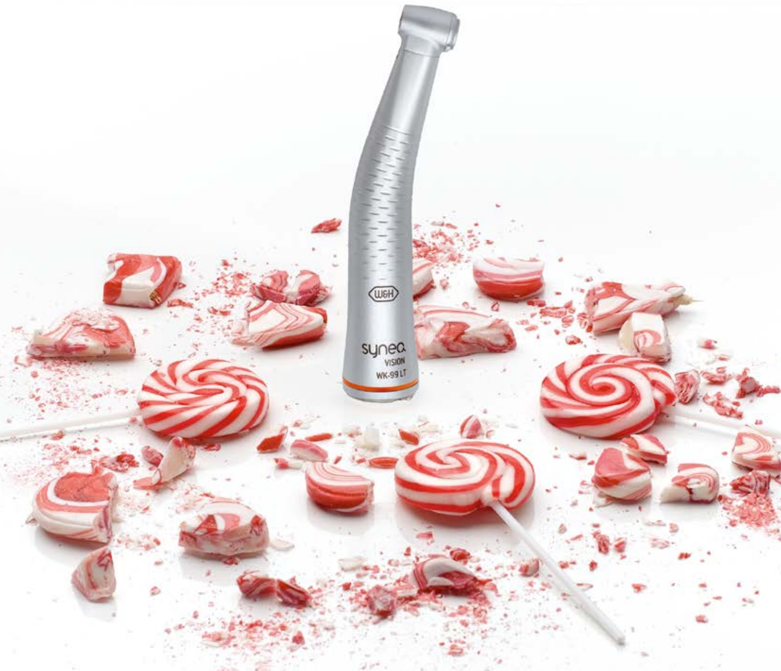
Abb. Symbolfotos. Zusatz-Ausstattung und Inhalt der gezeigten Zubehörteile sind nicht im Lieferumfang enthalten.

QR-Code mit dem Mobiltelefon scannen und mehr über Synea Winkelstücke erfahren